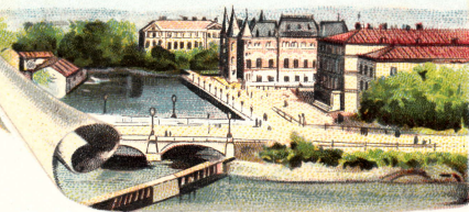
Logen, Sparbanken, Teatern.